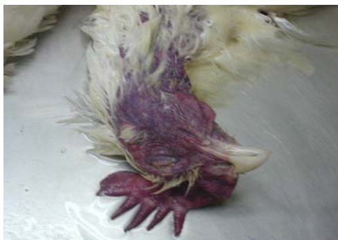
ក្បាលឡើងពណ៌ស្វាយ