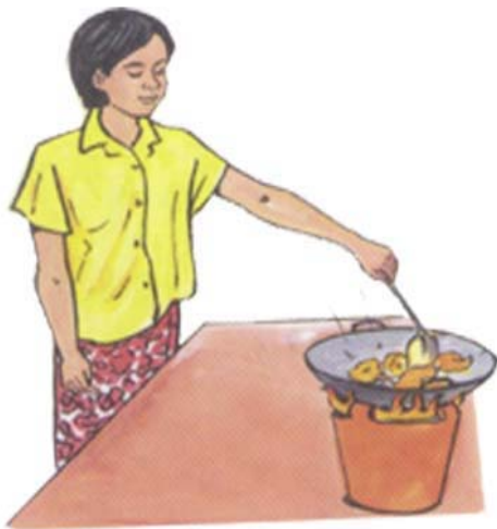
ចម្អិនអាហារឱ្យបានឆ្អិនល្អ