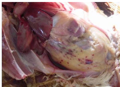
ជាំឈាមផ្នែកគ្រឿងក្នុង ជាពិសេសនៅស្រទាប់ខ្លាញ់