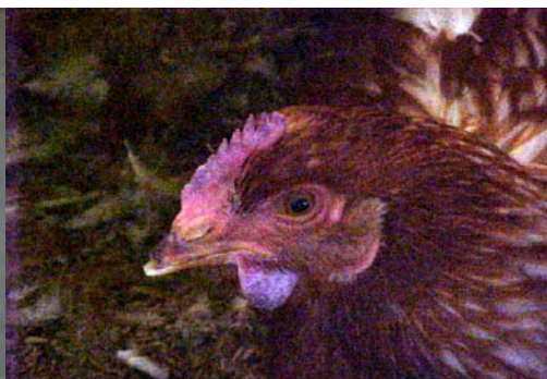
សិរ និង ណង់ពណ៌ស្វាយ