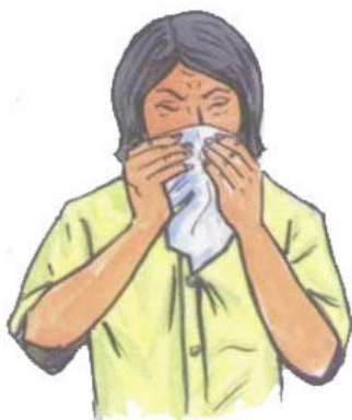
យកកន្សែងដៃខ្ទប់មុខពេលកណ្តាស់