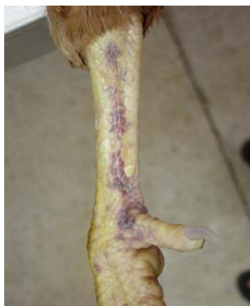
ជាំឈាមផ្នែកជើង