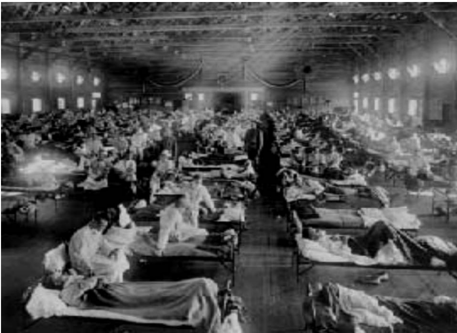
អ្នកជំងឺផ្តាសាយជាច្រើនកំពុងសំរាកព្យាបាលក្នុងពេលការរាតត្បាត ជំងឺផ្តាសាយជាសកល ក្នុងឆ្នាំ ១៩១៨-១៩១៩