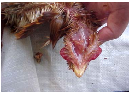
ស្នាមជាំឈាម