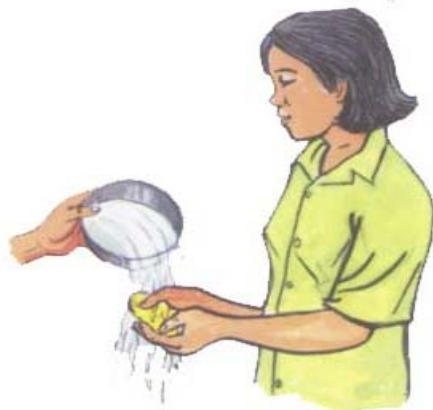
ឧស្សាហ៍លាងដៃនឹងសាប៊ូ