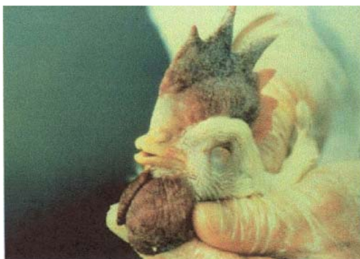
ហើមក្បាល សិរនិងណង់ហើមប៉ោង