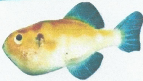
ត្រីត្រពតបៃតង (Max. 13 cm) Auriglobus nefastus Greenbottle pufferfish