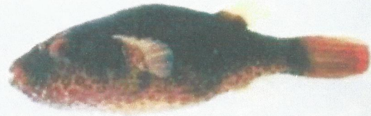
ត្រីត្រពតលឿង (Max. 15 cm) Tetraodon abei