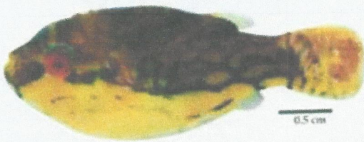
ត្រីត្រពតភ្នែកក្រហម (Max. 6 cm) Carinotetraodon lorteti Redeye pufferfish (ប្រភេទត្រីត្រពតពុល)