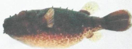
ត្រីត្រពតបន្លា (Max. 12 cm) Tetraodon baileyi