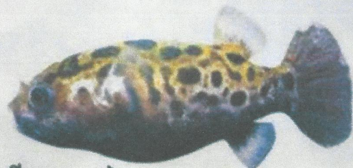
ត្រីត្រពតមុចបៃតង (Max. 17 cm) Tetraodon nigroviridis Spotted green pufferfish (ប្រភេទត្រីត្រពតពុល)