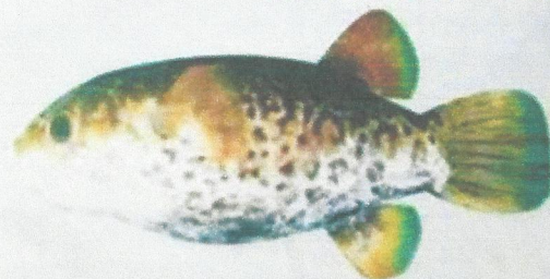
ត្រីត្រពត (Max. 17 cm) Tetraodon fluviatilis (ប្រភេទត្រីត្រពតពុល)