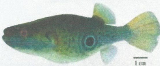
ត្រីត្រពតខ្មែរ (Max. 7 cm) Monotrete cambodgiensis Tetraodontidae